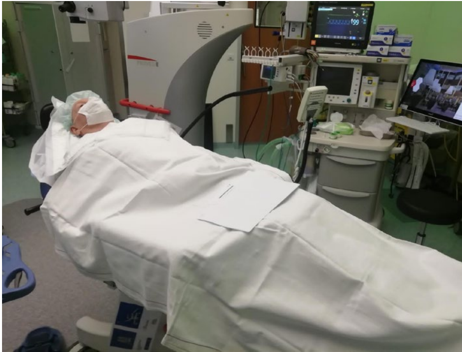
Afbeelding 2 Voorbeeld van een niet steriel laken waarmee de patiënt wordt afgedekt.