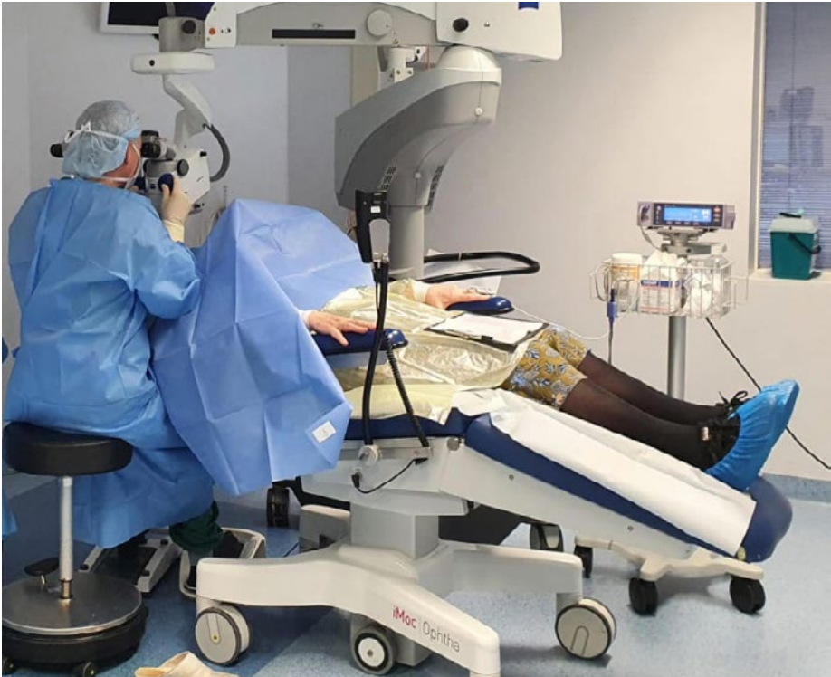
Afbeelding 1 Voorbeelden van (steriele) disposable patiëntenjassen.