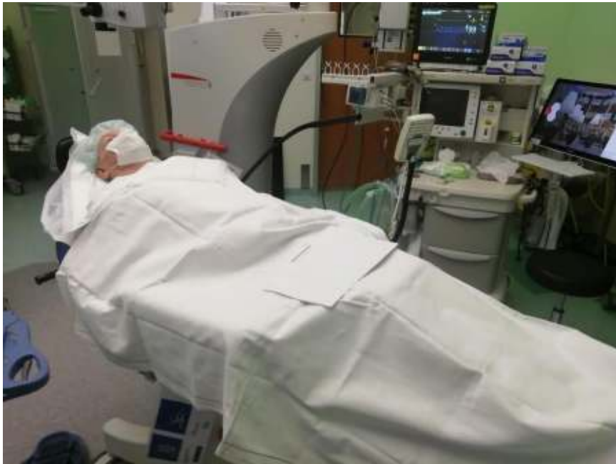
Figuur 3 Voorbeeld van een niet steriel laken waarmee de patient wordt afgedekt.