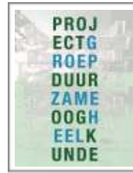
Figuur 1 Resultaten vraag 3 - Enquete Projectgroep Duurzame Oogheelkunde dec 2020

Totaal 40 klinieken waarvan: 4 UMC's; 9 STZ/Santeon ziekenhuizen; 10 perifere ziekenhuizen; 17 ZBC's (waarvan 9 ZBCs onder-