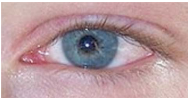
afb.1. Hoornvlies linker oog met herpes takjes t.h.v. pupilrand rechts

De duur en ernst van de ontsteking kan hierdoor variëren en ook kan de reactie op de behandeling verschillend zijn.